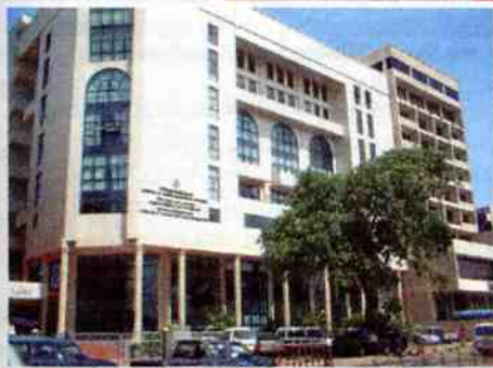
Know-how aus Österreich für die Tourismushochschule auf Sri Lanka – im Zuge der-Tsunami-Hilfe.

Malawi, das den Nutzen von Tourismus für Infrastruktur, verbesserte Sicherheit und Diversifikation betont. Oder Mosambik, das im Tourismus eine Antriebskraft für die verstärkte Inanspruchnahme lokaler Güter und Dienstleistungen sieht. Oder Sambia: Das Land setzt auf den armutsmindernden Effekt, den touristische Ausbildung bringen kann. Und damit ist es nicht alleine.