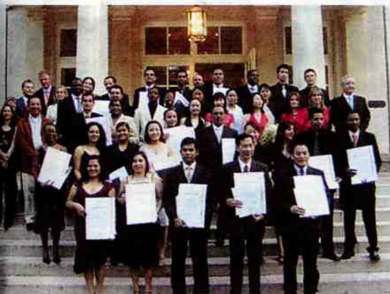
Talentschmiede Die Absolventen der Internationalen Tourismushochschule ITH in Salzburg/Klessheim können mit ihrem Diplom daheim etwas bewegen.